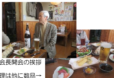
奈良会長開会の挨拶